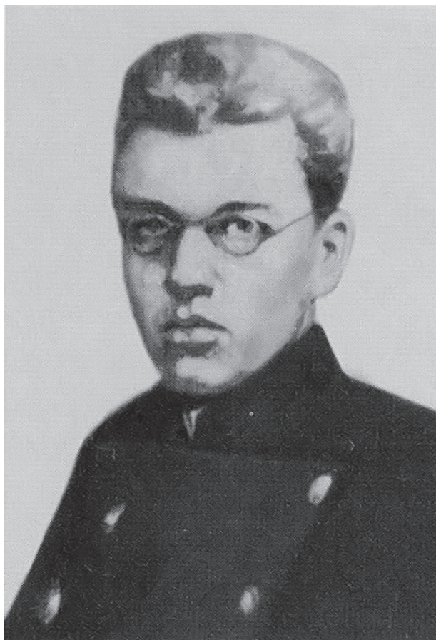
Рис. 2. Автопортрет Валентина Войно-Ясенецкого, 1900 г.

Автопортрет изображает независимого, погруженного в свои мысли молодого человека, исполненного решимости, с проникательным острым взглядом (рис. 2).