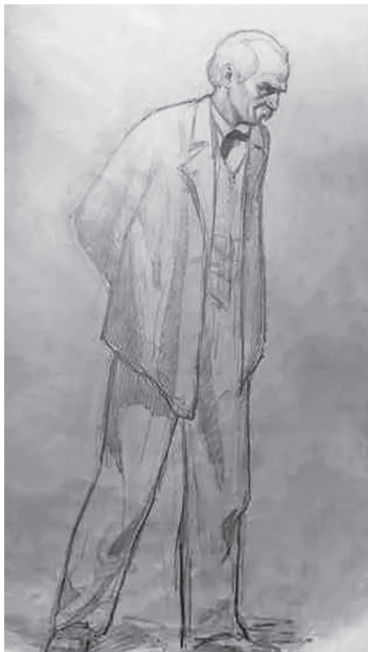
Рис. 4. Предполагаемый портрет профессора анатомии П. И. Карузина

щите Войно-Ясенецкого. На рисунке характерные черты облика Карузина — высокий с залысинами лоб, небольшие пушистые усы, резкие носогубные складки, густые брови, слегка насупленные над крупными глазами — дополнены еще и особенностями походки (руки за спиной, корпус чуть наклонен, спина сутулится), что вполне согласуется с некоторыми фотографиями Карузина, на которых видно, что он был много выше среднего роста и слегка сутулый (рис. 4).