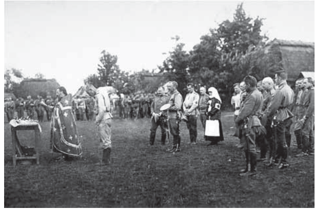
Молебен на фронте. 1915 г.

Кроме того, военному священнику предписывалось собирать сведения о подвигах всех воинских чинов своей части, критически исследуя каждый случай. Местом пребывания военного священника был передовой перевязочный пункт. Важна была роль священников и в укреплении боевой дисциплины. Еще осенью 1914 г. вышел приказ командования, в котором особо отмечалось, что: «в целях предупреждения распространения пропаганды революционного характера в батальоны будут назначаемы опытные священнослужители для совершения богослужений, ведения бесед и пастырского надзора за нижними чинами».