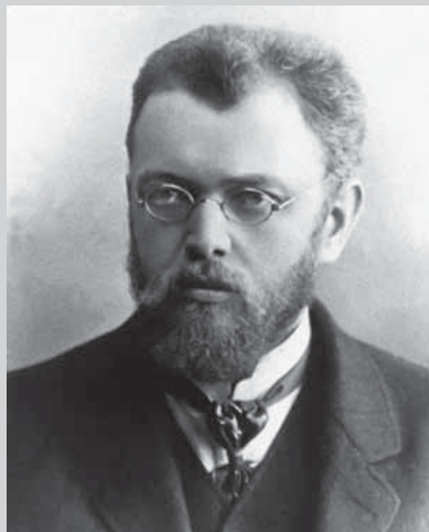
Валентин Феликсович Войно-Ясенецкий (1877–1961)

Сергей Сергеевич Юдин (1891–1954) был студентом медицинского факультета Московского университета, когда началась Первая мировая война. В августе 1914 г. он призван в действующую армию и отправлен на фронт в составе 5-го передового отряда Красного Креста. Работал зауряд-врачом в госпитале, оперировал раненых и даже участвовал в боевых операциях. Фронтовые офицеры ценили личную храбрость Сергея Юдина, его ловкость и самоотверженность. Он трижды был ранен, один раз тяжело, за храбрость награжден Георгиевским Крестом.