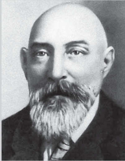
Владимир Петрович Филатов (1875–1956)