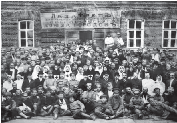
Лазарет для раненых и больных воинов. 1915 г.