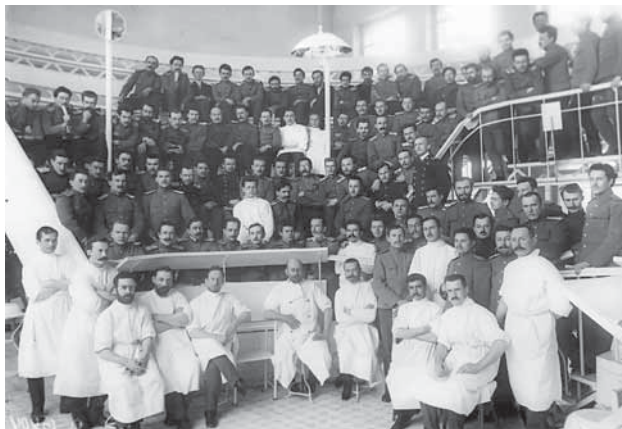
Проф. С. П. Федоров (в центре) с курсантами ВМА

Впервые в России (1893–1894) он приготовил противостолбнячную сыворотку, а в 1904 г. первым использовал для общей анестезии внутривенный гедоналовый наркоз, который широко применялся в Первую мировую войну. За рубежом этот метод обезболивания получил название «русского наркоза». В Великую войну 1 врач С. П. Федоров в должности лейб-хирурга сопровождал Российского императора Николая Александровича и цесаревича Алексея в поездках на фронт. Еще при жизни профессора его именем была названа 1-я хирургическая клиника Военно-медицинской академии, где установлена мемориальная доска в его память