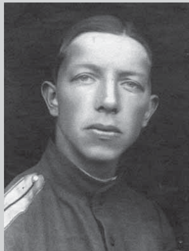
Сергей Сергеевич Юдин (1891–1954)