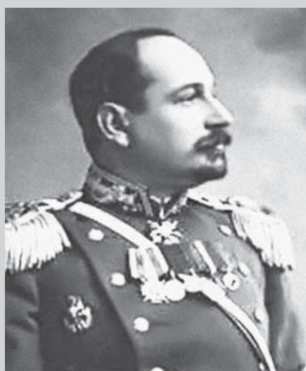
Сергей Романович Миротворцев (1878–1949)

Русским хирургом № 1 в области военно-полевой хирургии называют Николая Ивановича Пирогова. Его ученики достойно проявили себя на благо Отечества. Среди них всемирно известные врачи и ученые: