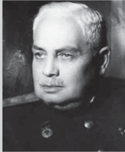
Семен Семенович Гирголав (1881–1957)