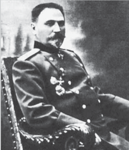
Леонид Георгиевич Беллярминов (1859–1930)