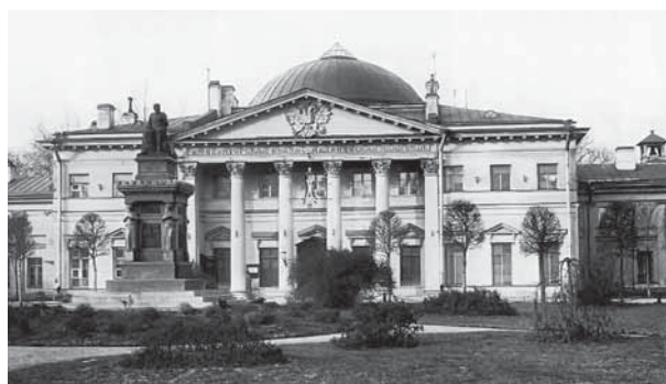
Императорская военно-медицинская академия

Врачей для российской армии готовила Императорская Военно-медицинская академия в Санкт-Петербурге, а также медицинские факультеты университетов, которые при объявлении войны выпускали студентов старших курсов в должности «зауряд-военный врач».