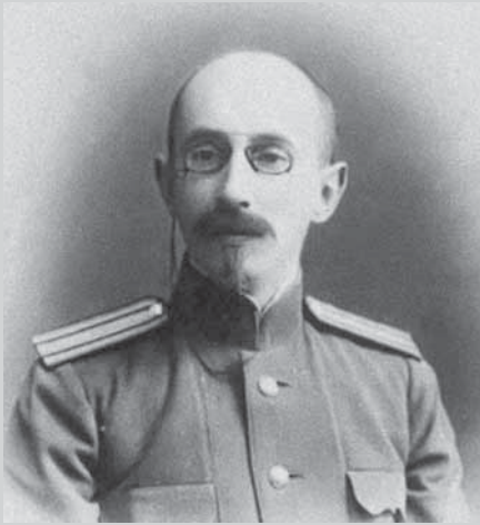
Николай Николаевич Петров (1876–1964)