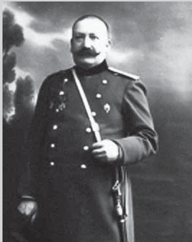
Роман Романович Вреден (1867–1934)