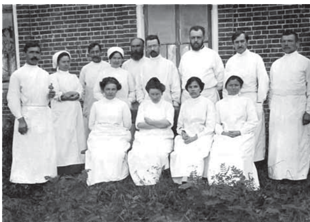
В. Ф. Войно-Ясенецкий (стоит 3-й справа) с персоналом лазарета

Священный Синод приравнял лечение раненых на фронтах Первой и Второй мировых войн хирургом-епископом Лукой к архиерейскому служению и возвел его в сан архиепископа в марте 1943 г. Архиепископ Лука (Войно-Ясенецкий) канонизирован Русской Православной Церковью в 2000 г.